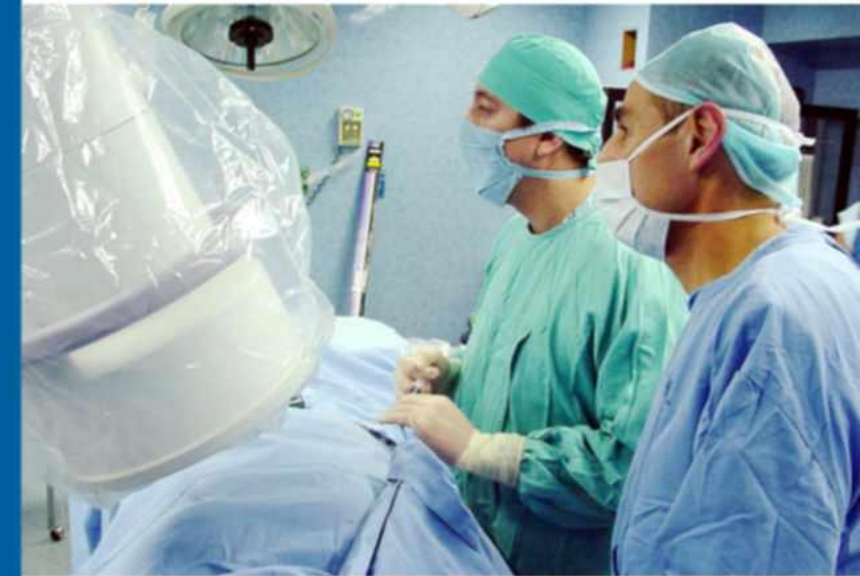
Sala de Hemodinámica donde se realizan los procedimientos

En INACEL, los pacientes son seleccionados rigurosamente a través de exámenes clínicos, pruebas de laboratorio y diagnóstico por imágenes, tales como: Resonancia Magnética, Tomografía Espiral Multicorte y Medicina Nuclear, con la finalidad de obtener información real y poder cuantificar los resultados de los tratamientos.